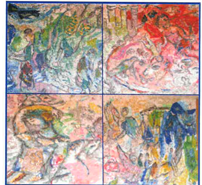
Fragment de la mosaïque de Chagall - Faculté de Droit et Science Politique de Nice