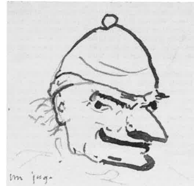
"Un juge", par Victor Hugo